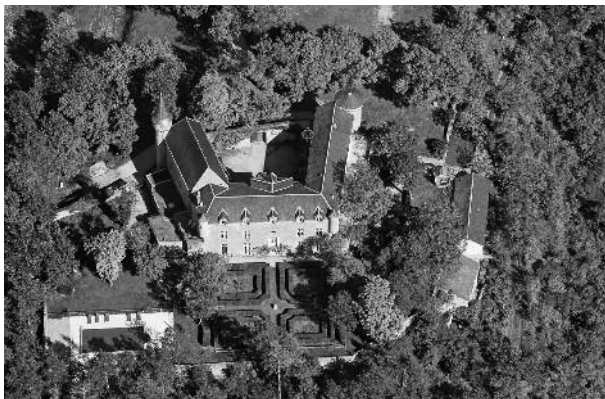
Château de Gissac