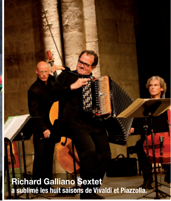
Richard Galliano Sextet a sublimé les huit saisons de Vivaldi et Piazzolla.