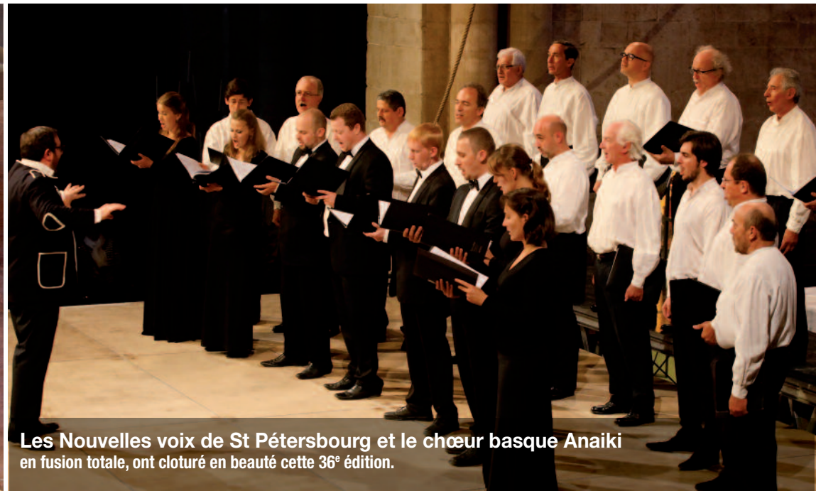
Les Nouvelles voix de St Pétersbourg et le chœur basque Anaiki en fusion totale, ont clôturé en beauté cette 36 e édition.