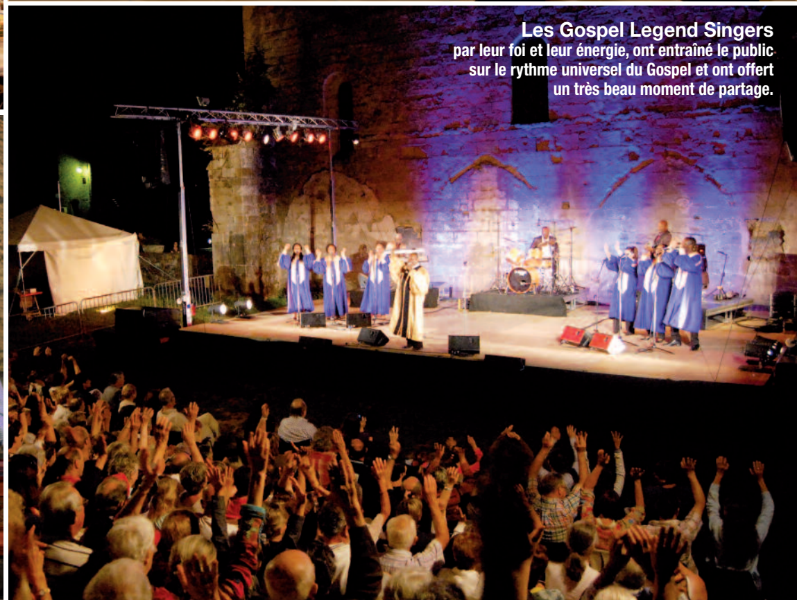
Les Gospel Legend Singers par leur foi et leur énergie, ont entraîné le public sur le rythme universel du Gospel et ont offert un très beau moment de partage.