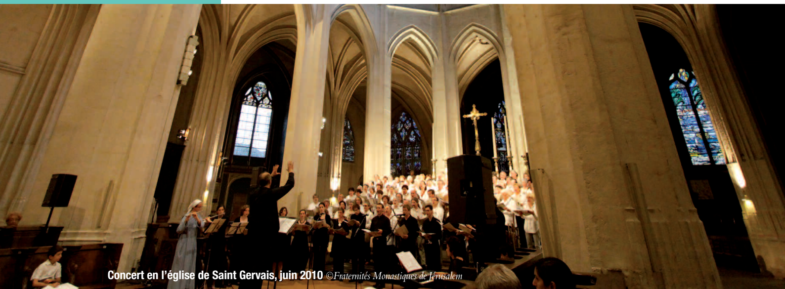
Concert en l'église de Saint Gervais, juin 2010