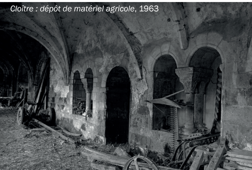
Cloître : dépôt de matériel agricole, 1963

Entre le XVII e et le XVIII e siècle, la salle capitulaire est transformée en salon de réception. Elle subit à cette occasion de nombreux remaniements : la fenêtre centrale est agrandie et un riche décor de stuc « en rocaille » est ajouté.