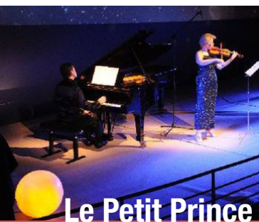
Le Petit Prince