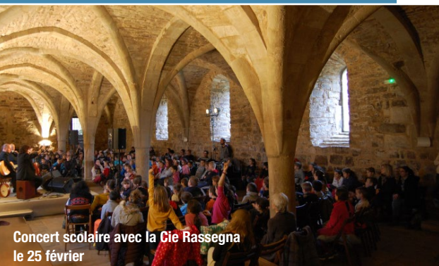
Concert scolaire avec la Cie Rassegna le 25 février