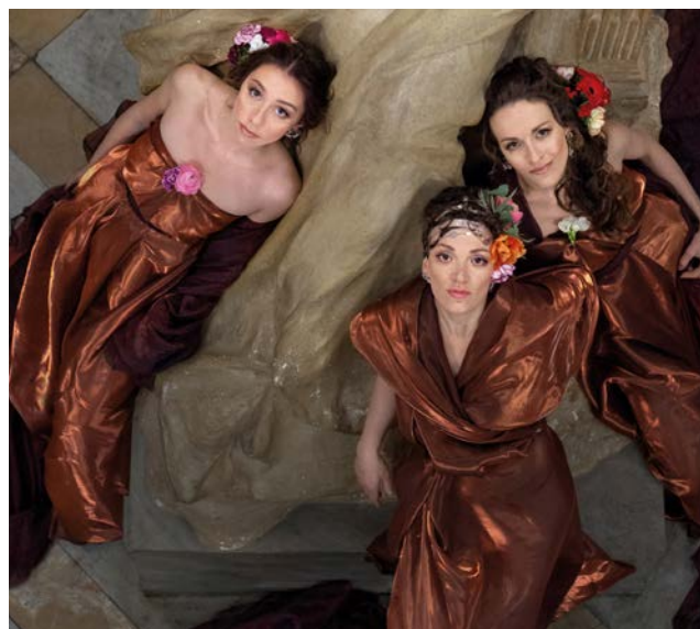
En savoir + : lesitinerantes.fr

Samedi 10 août // 21 h - Abbatale de Sylvanès